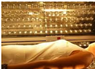
Slika 2. Primena delovanja polarizovane svetlosti na celu površinu tela ( http://www.sensolite.com/ )